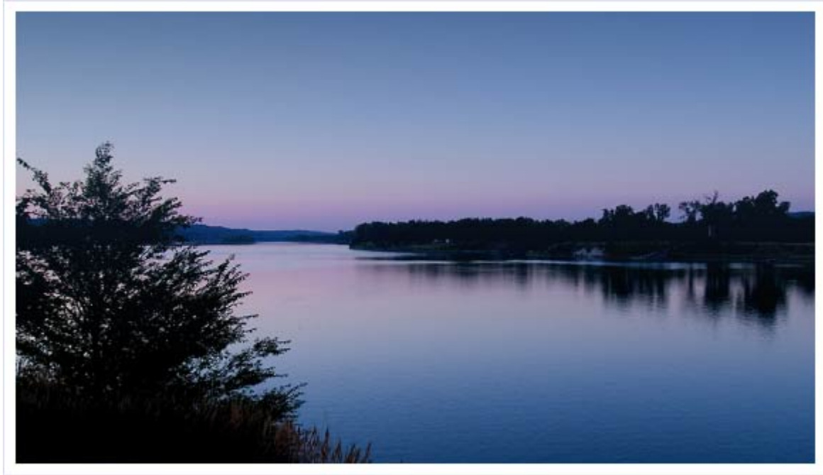
강. 역사가 흐르고 사연이 흐른다.

온통 흰 산이 되고, 제자리에 앉으면 그들이 들고 있던 죽창만 빼곡히 서 있기 때문에 대나무 산이 된다는 뜻이었다. 하지만 수적으로 우세한 농민군도 막강한 일본군의 화력을 이길 수 없었다. 우금치에서 패한 농민군은 마지막 논산에서의 결전을 끝으로 흩어지고 말았다. 전봉준도 배신자의 밀고로 순창에서 잡혀 처형되었고, 흩어진 농민군은 화적이 되거나 부자들을 털어서 가난한 자를 돕는 활빈당, 영학당이 되었다.